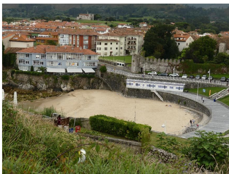
Voici l'hôtel Sablon

Les 18 participants à ce séjour sont revenus enchantés et émerveillés par la beauté des lieux visités et l'alternance mer/montagne. La météo était de la partie, ni trop chaud, ni trop froid, de légers embruns le mercredi après-midi. Il faut rajouter de très bons repas dans des restaurants tous les soirs pour reconforter les troupes. Avec la bonne humeur du groupe, tous les ingrédients étaient réunis pour un régal des papilles, des yeux et surtout un renforcement des mollets.