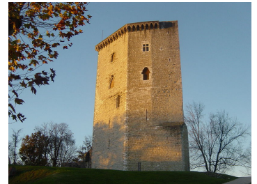
La Tour Moncade

Prix de la journée : 26 € tout compris ( resto , visites , pourboires ) Le Car sera payé par le Club .