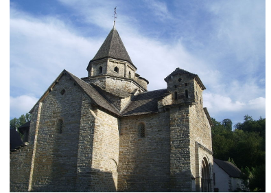
Eglise de l'Hôpital Saint Blaise

Visite à Ordiarp d'une fromagerie . Possibilité d'achat