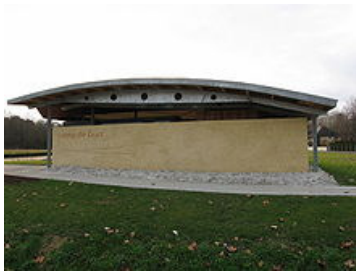
Mémorial du camp de Gurs

Visite guidée et commentée du camp d'internement de GURS