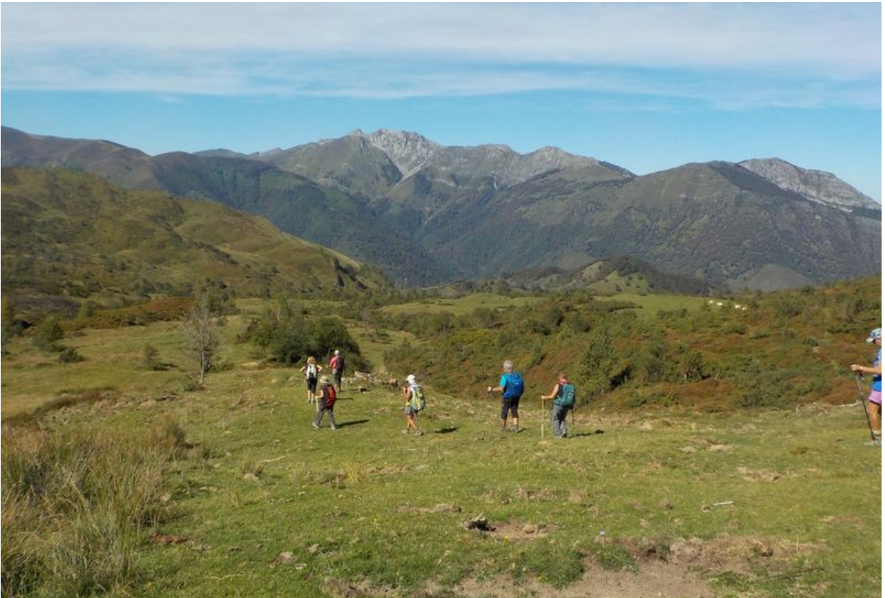
Contournement prudent des longues cornes.