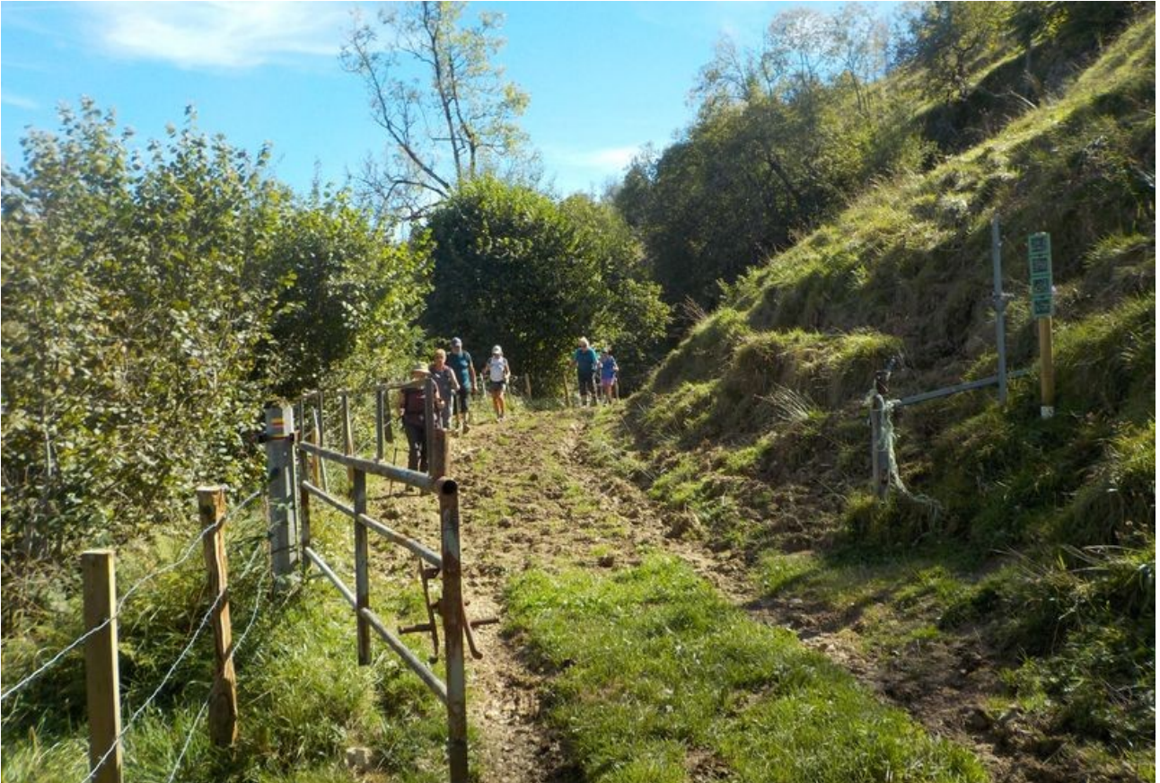
Navaillo, Bazès et vue sur le vallon du Hougarou.