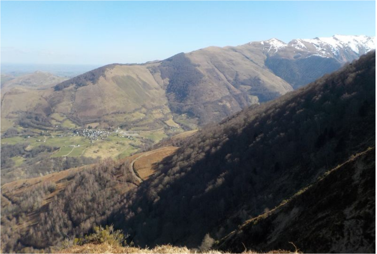
Plus on s'élève sur cette crête, plus la vue est belle. Bon, demi-tour.