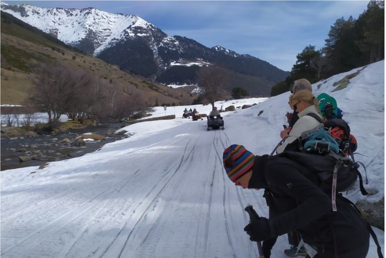
Nous repartons en suivant la piste et rencontrons les premières ruines de l'ancien hameau.