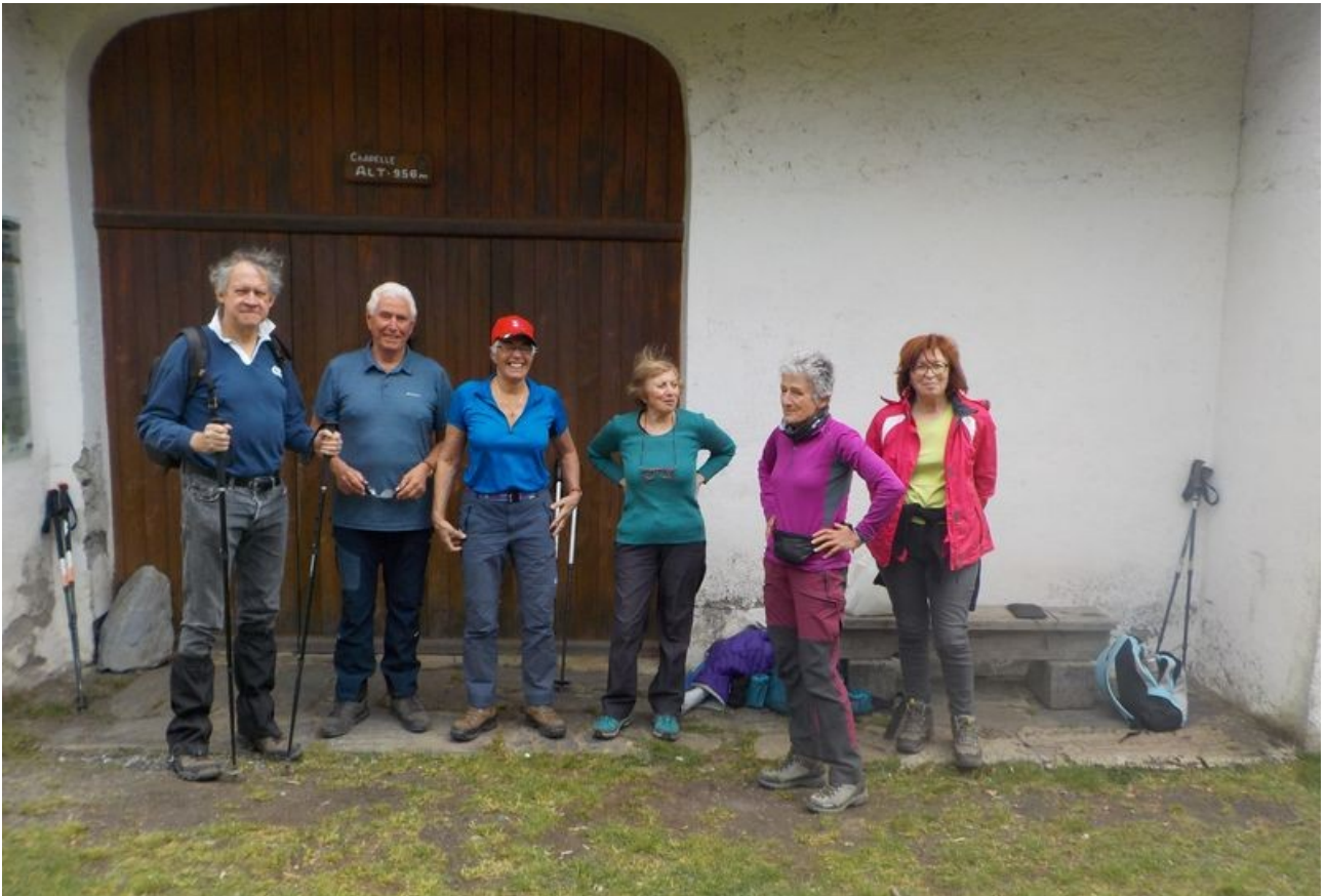
Après le repas, cela va descendre. Là encore, sur un chemin très bien tracé.