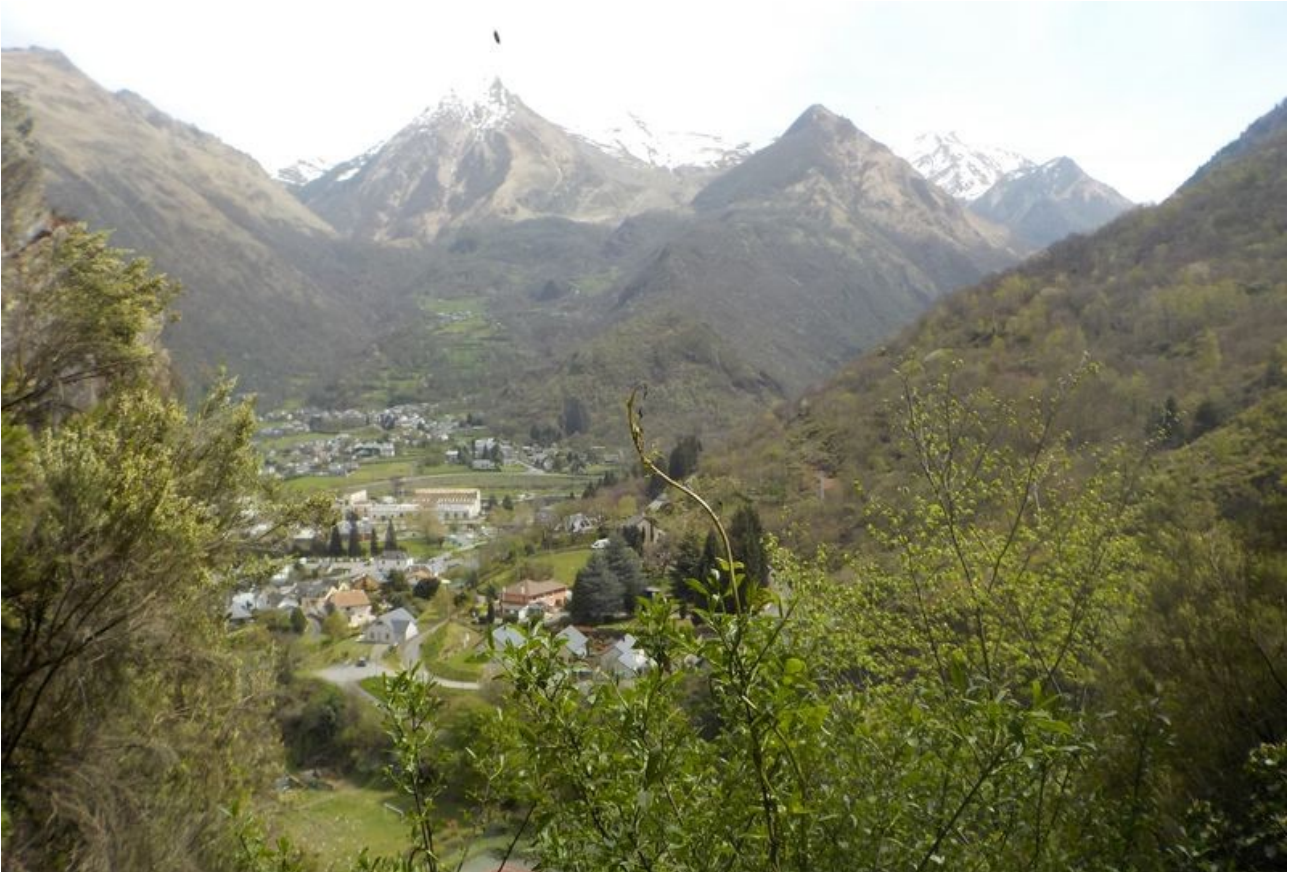
Après le tunnel, nombreuses vues vers Pierrefitte.