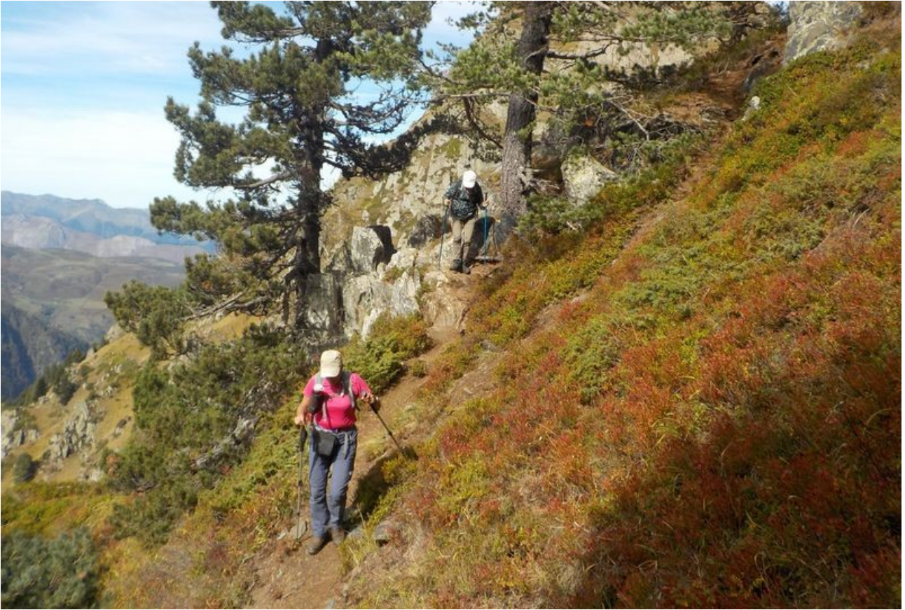
Suivi d'une remontée énergique.