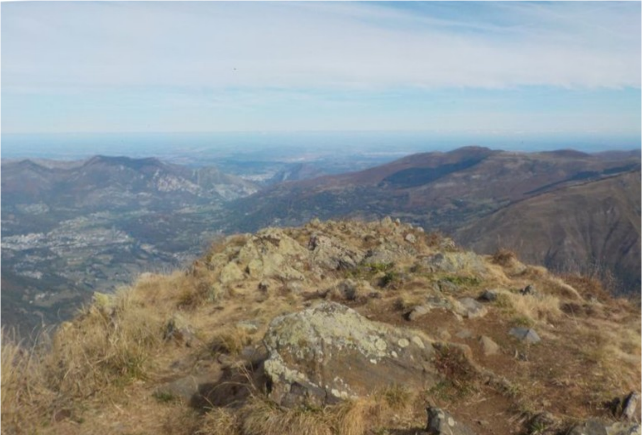
Vue vers les montagnes : du pic d'Ardiden au Balaitous.