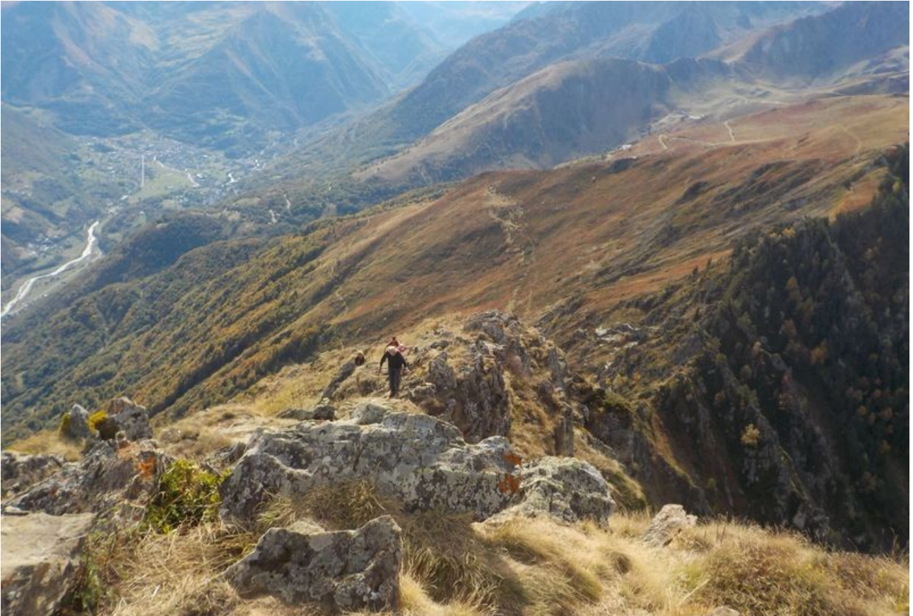
Photo du groupe de conquérants.