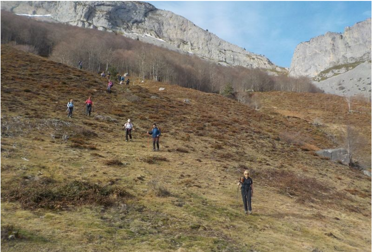
Nous allons entrer dans la forêt.