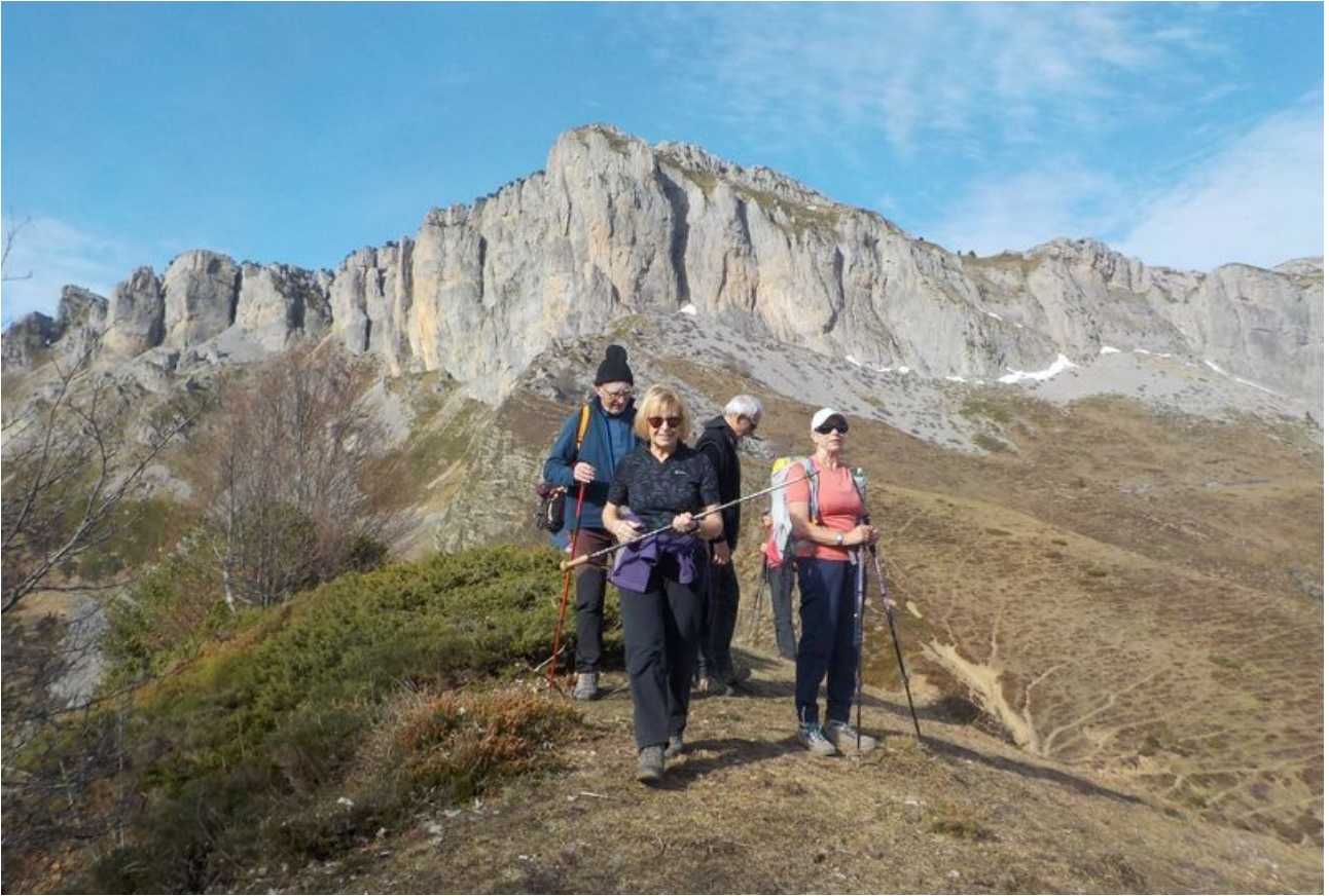
Photo du groupe des survivants.

Et vue imprenable sur les Orgues de Camplong.