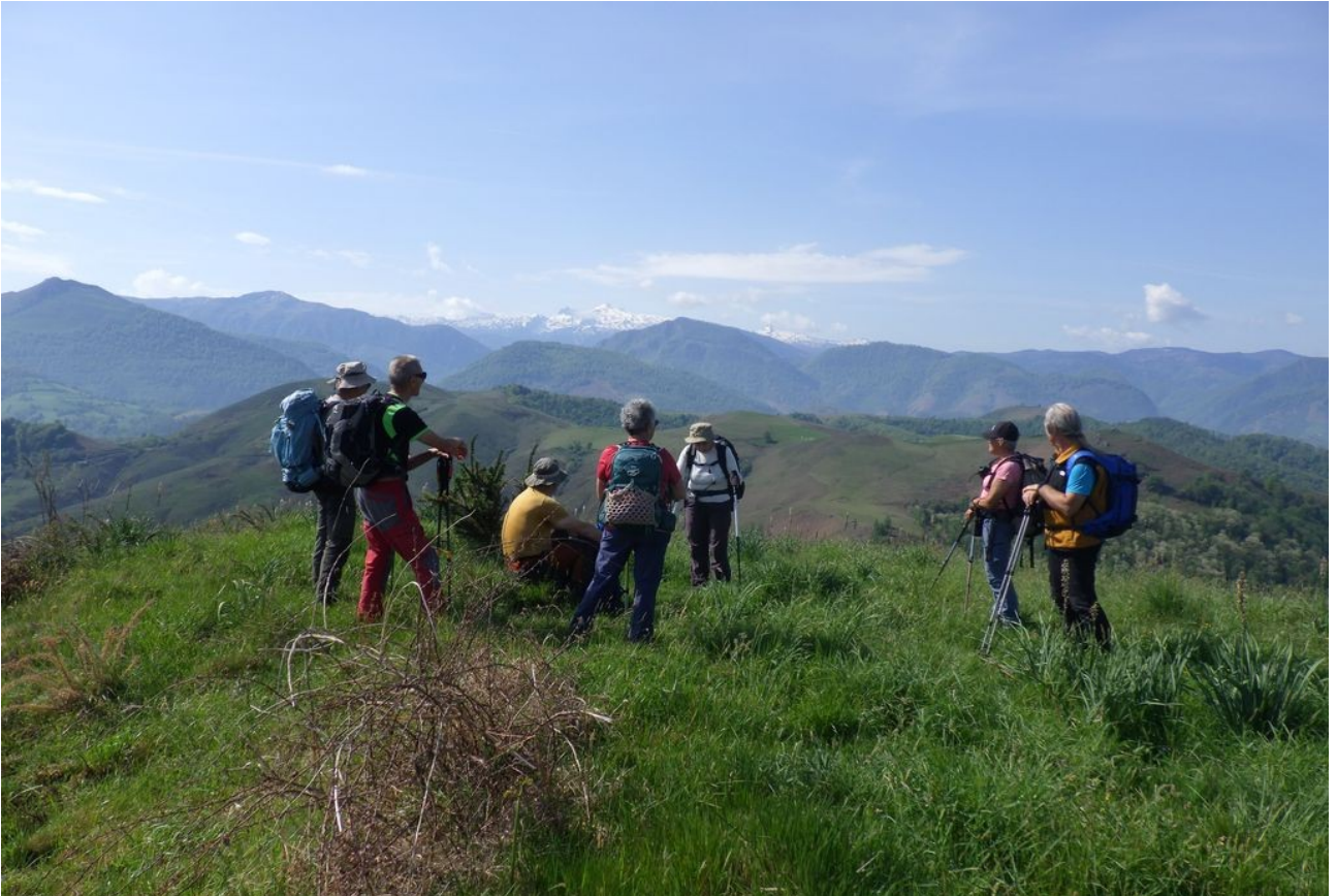
Photo souvenir de l'équipe.