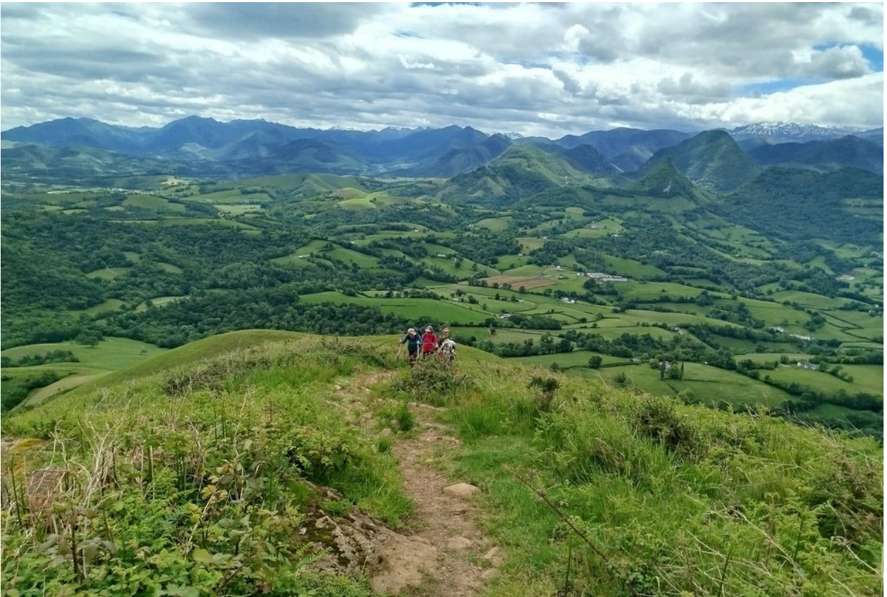
Photo du groupe. Altitude 695 m.