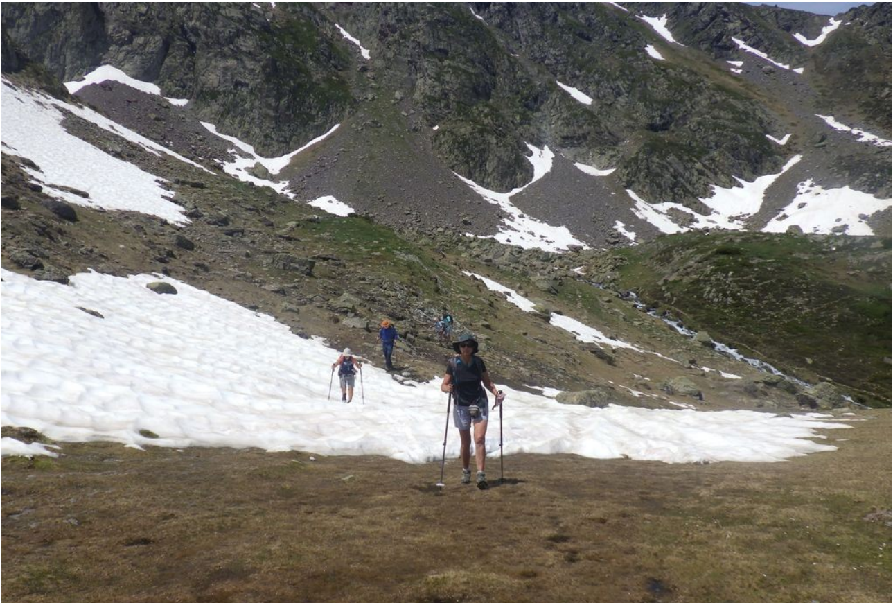
Un flaqué encore glacée...